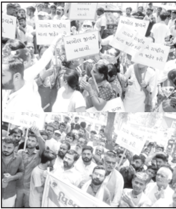
પણ મંત્રણ દિવસ પહેલા વીડિયો દ્વારા પક્ષ કહી હતી અને આજે પણ કહ્યું છે.

સાવરકુંડલામાં વિવિધ હિન્દુ સંગઠનો દ્વારા કતલખાના મુદ્દે નીકળી મૌન રેલી કાઢી. મામલતદાર તેમજ ધારાસભ્ય દ્વારા આવેદનપત્ર પાઠવવામાં આવ્યું. વિશ્વ હિન્દુ પરિષદ, બજરંગદળ, દુર્ગા વાહિની હિન્દુ યુવા સેના તેમજ સાધુ સંતો આ મૌન રેલીમાં જોડાયા હતા. સાવરકુંડલા રિદ્ધિ સિદ્ધિનાથ મહાદેવ મંદિરથી મામલતદાર કચેરી સુધી મૌન રેલી કાઢી નગરપાલિકા દ્વારા જે ગેરકાયદેસર કતલખાનાને બંધ કરાવવા તેમજ કતલખાનાને મંજૂરીની તજવીજ હાથ ધરાઈ હતી. તેમના વિરોધમાં મૌન રેલીનું આયોજન કરવામાં આવ્યું હતું. સાવરકુંડલા નગરપાલિકાએ કોઈ કતલખાનાની મંજૂરી આપી નથી અને ભવિષ્યમાં પણ આવી મંજૂરી આપવાનો કોઈ પ્રોગ્રામ નથી. જ્યારથી આ ગેરસમજણનો મેસેજ કરે છે ત્યારે