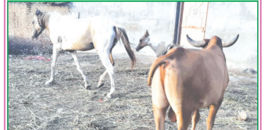
સમય બદલાઈ ત્યારે સઘળું બદલાઈ જાય છે. વર્ષો પૂર્વે ભારત વર્ષમાં રાજશાહી, અંગ્રેજ શાસન, મોગલ સલ્તનતની બોલબાલા હતી. સમય જતાં લોકશાહી આવી લોકો વડે, લોકો માટે, લોકો દ્વારા અને લોકોથી ચાલતી એક અદ્ભુત સિસ્ટમ અમલમાં આવી જેને આપણે લોકશાહી કહીએ છીએ. એ લોકશાહીને પણ આજે પંચોતેર વર્ષ કરતાં વધુ સમય ગાળો થઈ ગયો. આ સંદર્ભે આપણે સહુ સાથે મળીને અમૂત મહોત્સવ પણ મનાવતાં જોવા મળ્યાં. આજે ખાસ તો વાત કરવી છે એ રાજશાહી સમયે પ્રવર્તતી અશ્વોની સંખ્યા હાલ નહિવત જોવા મળે છે. અશ્વ એ યુદ્ધ અને સંદેશા વ્યવહાર માટે ખૂબ સમજદાર અને વિસનીય પ્રાણી ગણાતું. ચેતક અને અનેક અશ્વોની યુદ્ધ મેદાનમાં એની બહાદુરી, સમજદારી, અને સ્વામિભક્તિની વાતો આજે પણ ઈતિહાસમાં અમર ગાથા સમાન છે. તેજીને ટકોરો એ કહેવત પણ લોકજીભે અવારનવાર ચડતી હોય છે. એ બાબત પણ અશ્વોની સેન્સિટીવિટી તરફ અંગુલિનિર્દેશ કરે છે. આમ અશ્વ એ એક અત્યંત શક્તિશાળી અને સમજદાર પ્રાણી છે. હાલના બુલેટ ટ્રેનના સમય અને સંજોગોમાં અશ્વોની સંખ્યા દિન પ્રતિદિન ઘટતી જાય છે એ બરેબર ચિંતાનો વિષય જ ગણાય. ક્યાંક એકલદોકલ એ જોવા મળે ત્યારે એ અશ્વોની સમજદારીને પ્રજ્ઞામ કરવાનું મન થાય એ સ્વાભાવિક છે.