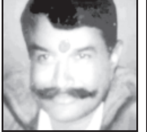
૧ વાગ્યા સુધી. તો આવો સૌ આ મહામુલા આરોગ્ય યજ્ઞમાં આપણે સૌ રક્તદાન કરીએ.