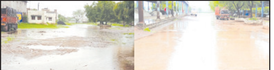
અમરેલી, તા. ૨૭ અમરેલી જિલ્લાનાં પાંચ જેટલાં તાલુકામાં હળવા ઝાંપટાથી લઈ અને પોણા બે ઈંચ જેટલો વરસાદ વરસી જતાં જગત્તાત વાવણી કાર્યમાં જોતરાયો છે. જ્યારે કાચા સોના સમાન વરસાદથી લોકોમાં પણ આનંદ છવાયો છે. આજે દિવસ દરમિયાન અમરેલીમાં ૧ મી.મી., ધારી ૬ મી.મી., લાઠી ૪૨ મી.મી. જ્યારે સાવરકુંડલામાં ૩૭ મી.મી. વરસાદ પડ્યાનું કલક કટ્ટોલરમે જણાવ્યું હતું.