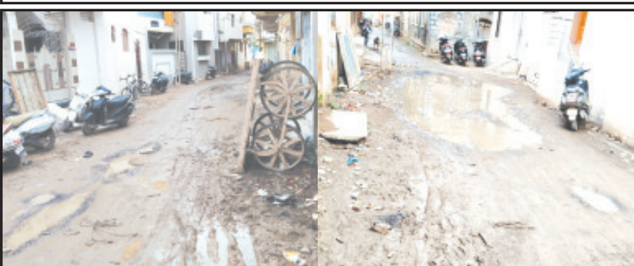
અમરેલી, તા. ૨૭, અમરેલીનાં હરિલાલપા વોર્ડમાં ઘણા મહિનાઓથી માર્ગ બનાવાતો નથી, ભૂગર્ભ ગટરનાં ખોદકામ બાદ ધ્યાન બાર અતિ બિસ્માર બની ગયો હોય તેવામાં વરસાદ પડતાં ટેકેટકાણે પાણી ભરાતા સ્થાનિકોને ઘર બહાર નીકળવાની મુશ્કેલી હોય પાલિકાનાં શાસકો યોગ્ય કરે તેવી માંગ ઉભી થઈ છે.

વરસાદી માહોલમાં ઘરની બહાર નીકળવું મુશ્કેલ