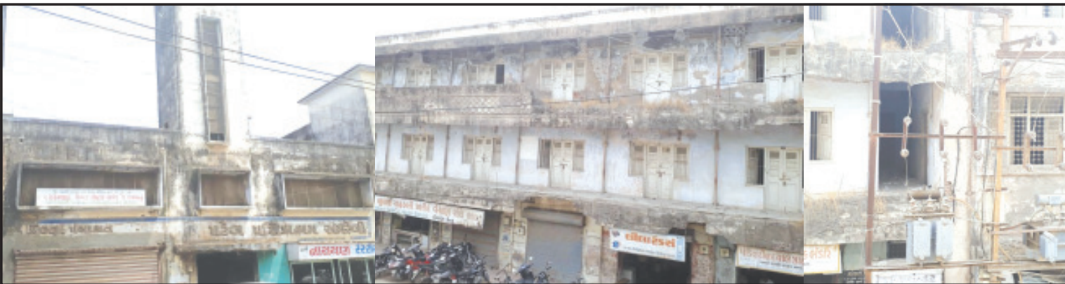
અમરેલી, તા. ૨૭ અમરેલીનાં સ્ટેશન રોડ પર આવેલ અને એક સમયે ધમધમતા જિલ્લા પંચાયત સંચાલિત પથિકાશ્રમનાં બિસ્માર બનેલ મકાનને દૂર કરીને તે જ સ્થળે નવું પથિકાશ્રમ બનાવવા માટે જિલ્લા પંચાયત દ્વારા તેયારીઓ શરૂ કરવામાં આવી હોવાનું જાણવા મળેલ છે. વર્ષો પહેલા પથિકાશ્રમમાં અનેક રાજકીય આગેવાનોનો ઉતારો રહેતો હતો તો સરકારી કર્મચારીઓ કે અન્ય કોઈ આમ આદમીને પણ રાહતદરે રહેવાની વ્યવસ્થા મળતી હતી. પરંતુ કાળક્રમે તેમાં સુવિધાનો વધો ન થયો અને ક્રમશઃ તે મકાનની હાલત બિસ્માર બનતાં છેલ્લા ૨ દાયકાથી પથિકાશ્રમ સાવ બંધ કરી દેવામાં આવેલ છે. અતિ મોકાનાં સ્થળે આવેલ પથિકાશ્રમનાં મકાનને જમીનદોસ્ત કરીને તે જ સ્થળે સુવિધાસભર પથિકાશ્રમ પુનઃ કાર્યરત કરવાની તેયારી જિલ્લા પંચાયતનાં પદાધિકારીઓ દ્વારા શરૂ કરવામાં આવી હોવાનું જાણવા મળેલ છે.

ભવિષ્યમાં સમગ્ર મકાનને જમીનદોસ્ત કરીને નવનિર્માણ થશે તેવું અનુમાન