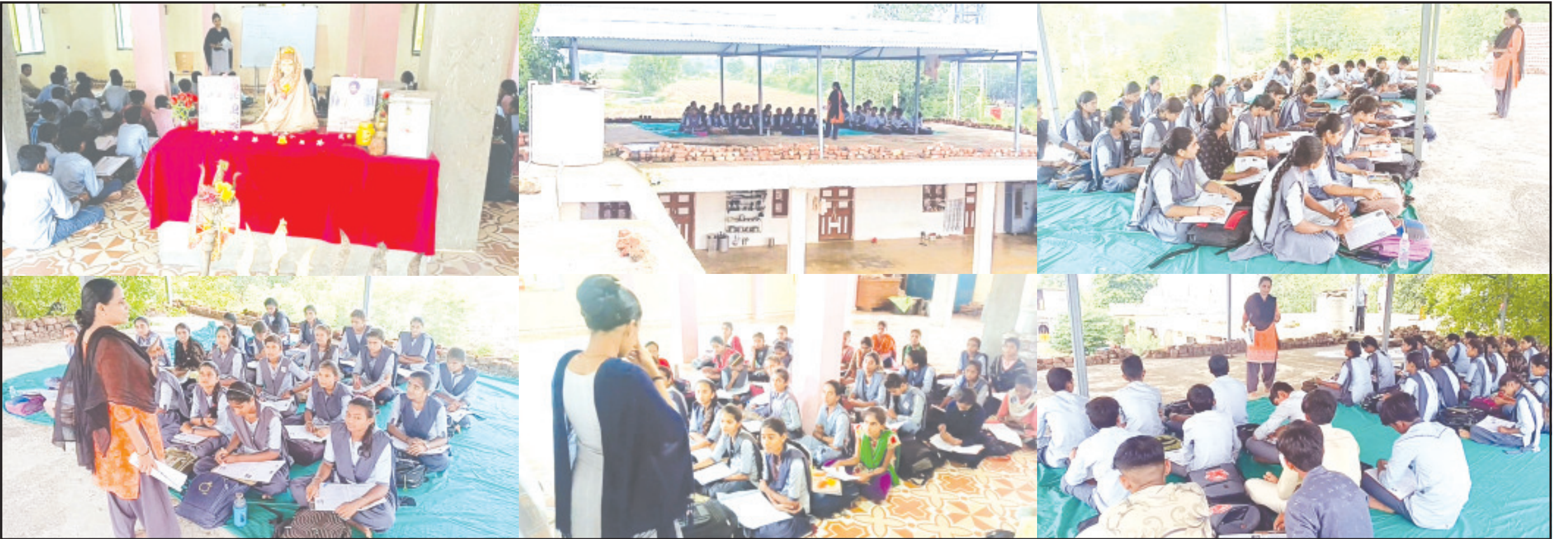
અમરેલી, તા. ૨૭ ગાંધીના ગુજરાતમાં શિક્ષણ પાછળ સરકાર કમર કસતી હોવાની સુક્રિયાણી વાનો વચ્ચે શાળા પ્રવેશોત્સવ, કન્યા કેળવણી જેવા સ્લોગનો સામે એક એવી શાળા કે જે સરકાર દ્વારા મંજૂર કર્યાના ૭ વર્ષના વાણા વીતી ગયા બદ પછર ૨૩૦ જેટલા વિદ્યાર્થીઓને પંચમુખી હનુમાનજીના મંદિરના આશ્રમમાં બેસીને અભ્યાસ કરવાની મજબૂરી છે. અમરેલી જિલ્લાના ગીરના ગામડામાં અમરેલી એક્સપ્રેસ દ્વારા આશ્રમમાં ચાલતી અનુસંધાન પાના ૬ ઉપર

૪યાં સુધી શિક્ષણ અને આરોગ્યની સેવા નહી સુધરે ત્યાં સુધી જીડીપી વધવાનો કોઈ અર્થ રહેતો નથી