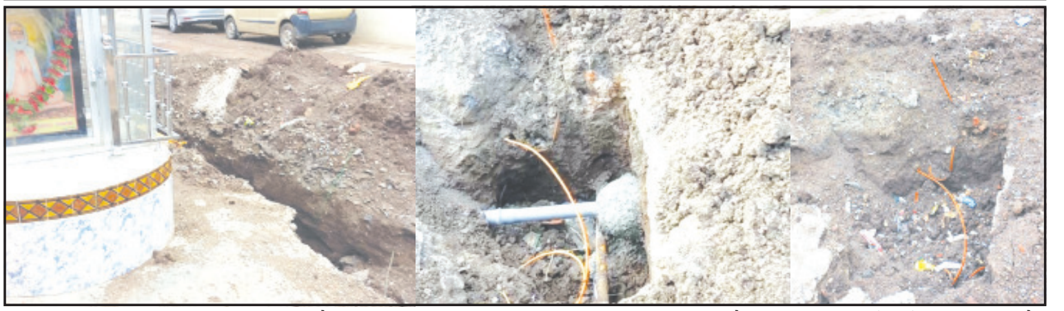
અમરેલી, તા. ૨૬ લાઠી રોડ વિસ્તારમાં એસ.ટી. ડિવીઝનની સામેના વિસ્તારમાં અક્ષરવાડી મેઈન રોડ પર આવેલ વૃંદાવન પાર્ક નાં-૩ સોસાયટીમાં પાપાસીતારામ ચોક આવેલ છે. આ બાપાસીતારામ ચોકની જમીનમાં ખોદાણ કામ કરી નગરપાલિકાની પાઈપલાઈનમાંથી ગેરકાયદેસર મોટી પાઈપલાઈન નાખી પાઈપલાઈનમાં અનુસંધાન પાના ૬ ઉપર

સ્થાનિક રહેવાસીઓ વતી જાગૃત નાગરિકે ચીફ ઓફિસરને વિસ્તૃત પત્ર પાઠવ્યો