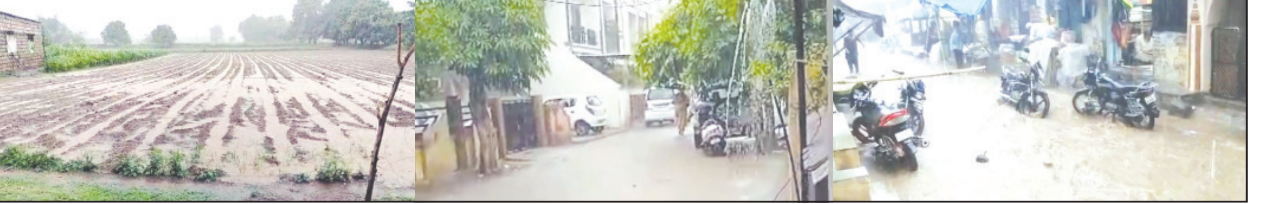
અમરેલી તા. ૨૬ સતત બીજા દિવસે પણ મેઘસવારી અમરેલી જિલ્લામાં આજે અવિરત ચાલુ રહેતા સર્વત્ર અડધાથી બે ઈંચ જેટલા વરસાદથી ખેતરો પાણીથી તરબતર થતા ખેડૂતોમાં હરમની હેલી છવાયેલ હતી. અમરેલી શહેરમાં ગઈકાલ સવારથી જ વરસાદી માહોલ છવાયેલ હતો. જેમાં ધોધમાર અટી ઈંચ જેટલા વરસાદથી સર્વત્ર પાણી છવાઈ ગયેલ હતા. શહેરની બજારો, ગલીઓમાં પાણી છવાતા નદીઓ સમાન ભાસતી હતી. બાબરા પંચકમાં ગઈકાલે સાંજના સમયે મેઘાવી માહોલ વચ્ચે એક ઈંચ વરસાદ ખાખરી જતા કાગડોળે વરસાદની રાહ જોતા ધરતીપુત્રોમાં

અમરેલીમાં રવિવારે બે ઈંચ તો બાબરા, લાઠી, વડિયા પંચકમાં એક ઈંચ જેટલો વરસાદ ર દિવસથી સતત મેઘાવી માહોલથી વાતાવરણમાંથી ગરમી ગાયબ, વાતાવરણ ઠંડુગાર બાબરાનાં ખાખરીયા, દરેડ, ગળકોટડી, હીરાણા, જામ બરવાળા, દેવળીયા, શોખ પીપરીયા, ખીજડીયા સહિતના ગામોમાં પહેલા વરસાદના આગમનથી લોકોમાં આનંદની લાગણી છવાયેલ હતી. કારમી ગરમી વચ્ચે વરસાદથી હવામાન ઠંડુગાર બની ગયેલ હતું. લીલીયા પંચકમાં પણ એક ઈંચ જેટલો વરસાદ પડેલ હતો. વડિયા પંચકમાં પોણો ઈંચ જેટલા વરસાદથી પાણી છવાયેલ હતા. વડિયાના મોરવાડ, બગસરા, ખાખરીયા સહિતના ગ્રામ્ય વિસ્તારમાં વરસાદથી પાણી છવાઈ ગયેલ હતા.