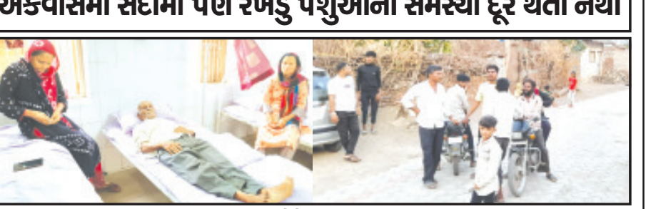
અમરેલી, તા. ૨૧ અમરેલી જિલ્લામાં થોડા સમયથી સ્વાનો ખૂબ જ ત્રાસ હોય, રોડે ચાલીને જતાં-આવતાં લોકોને ઓંચીતી રીતે જ બચકા ભરી લે છે. ત્યારે હવે તેમાં ઓછું હોય તેમ બાબરા પંથકમાં આજે ૪ જેટલા લોકોને ભૂંડે બચકા ભરી લેતા ૪ લોકોને અમરેલી તથા ૧ ને બાબરા દવાખાને સારવારમાં ખસેડવામાં આવ્યાં છે. જ્યાં આજે ત્રણ-ત્રણ વ્યક્તિઓને આ ભૂંડે હડકેટ લઈ ઈજા કર્યાં જાણવા મળેલ છે. બાબરા પંથકનાં લોકોને ભૂંડના ત્રાસમાંથી મુક્તિ અપાવવા અને ભૂંડને શહેર બહાર હાકી કાઢવા માટે પણ માંગ ઉભી થવા પામી છે.

રખડતા સ્વાન, ખૂંટિયા બાદ હવે ભૂંડ બેકાબુ થયા બાબરામાં ભૂંડે ૪ વ્યક્તિઓને બચકા ભરી લેતા તમામને સારવારમાં ખસેડાયા એકવીસમી સદીમાં પણ રખડુ પશુઓની સમસ્યા દૂર થતી નથી