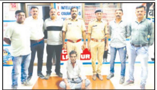
જી.પી. એક્ટ ક. ૧૩૫ મુજબનો ગુન્હો તા. ૧૮/૬/૨૩નાં રોજ રાત્રીનાં આશરે સાડા આઠેક વાગ્યાથી તા. ૧૮/૬/૨૩નાં રોજ રાત્રીનાં આશરે બે વાગ્યા દરમિયાન અમરેલી કુંકાવાવ અનુસંધાન પાના ૬ ઉપર

અમરેલી, તા. ૨૧ અમરેલી ટાઉનમાં કુંકાવાવરોડ, ઈટોનાં ભણા પાસે આવેલ આરોપીમાં આગ લગાડી બે ઈસમોને જાનથી મારી નાખવાની કોશિષ કરી, ગુન્હાને અંજામ આપી નાસી ગયેલ આરોપીને ગણતરીની કલાકોમાં અમરેલી સીટી પોલીસ ટીમે ઝડપી લીધેલ છે. ગુન્હાની વિગત એવા પ્રકારની છે કે, અમરેલી સીટી પો.સ્ટે.એ. પાર્ટ ગુ.ર.નં. ૧૧૧૮૩૦૦૩૨૩૦૩૮૮/૨૦૨૩ ઈ.પી.કો. ક. ૩૦૭,૪૩૬,૪૨૭, ૪૩૪,૩૨૩, ૫૦૬(૨), ૫૦૪ તથા