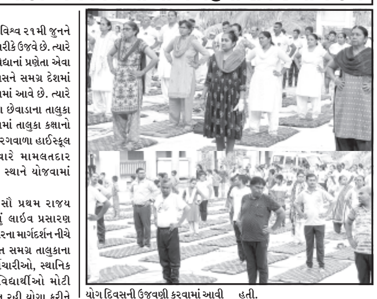
યોગ દિવસની ઉજવણી કરવામાં આવી હતી.

સમગ્ર વિશ્વ ૨૧મી જુનને વિશ્વ યોગ દિવસ તરીકે ઉજવે છે. ત્યારે વિશ્વ સાથે યોગવિદ્યાનાં પ્રભેતા એવા ભારતમાં આ દિવસને સમગ્ર દેશમાં યોગ કરી ઉજવવામાં આવે છે. ત્યારે અમરેલી જિલ્લાના છેવાડાના તાલુકા મથક એવા વડિયામાં તાલુકા કક્ષાના યોગ દિવસ શ્રી સુરગવાળા હાઈસ્કૂલ ખાતે વહેલી સવારે મામલતદાર મહેતાના અધ્યક્ષ સ્થાને યોજવામાં આવ્યો હતો. જેમાં સૌ પ્રથમ રાજ્ય કક્ષાના કાર્યક્રમનું લાઈવ પ્રસારણ નિઝામી માર્ટર ટ્રેનરના માર્ગદર્શનનીચે મામલતદાર સહિત સમગ્ર તાલુકાના અધિકારીઓ, કર્મચારીઓ, સ્થાનિક નાગરિકો અને વિદ્યાર્થીઓ મોટી સંખ્યામાં ઉપસ્થિત રહી યોગ કરીને