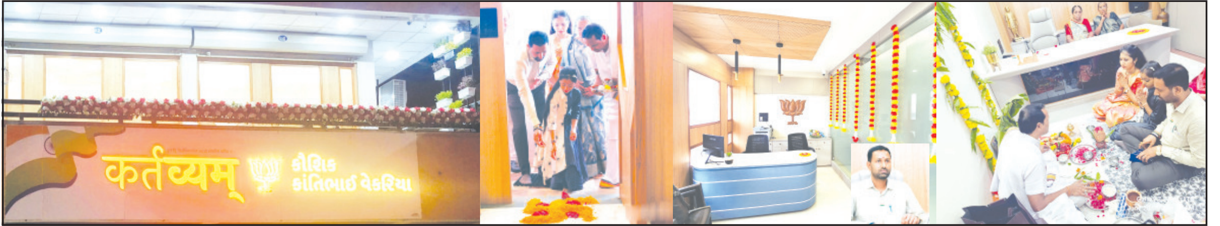
અમરેલી, તા. ૨૧ અમરેલી વિધાનસભા વિસ્તારનાં અમરેલી-કુંકાવાવ-વડિયા

યુવા નેતાએ તેમની લાડલી દીકરીનાં વરદહસ્તે કાર્યાલયનો પ્રારંભ કર્યો