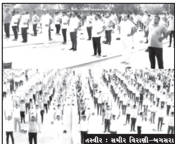
મેઘાણી હાઈસ્કૂલનો સ્ટાફ, વિદ્યાર્થીઓ બહોળી સંખ્યામાં આ આંતરરાષ્ટ્રીય યોગ દિવસની ઉજવણી કરવામાં આવી હતી.