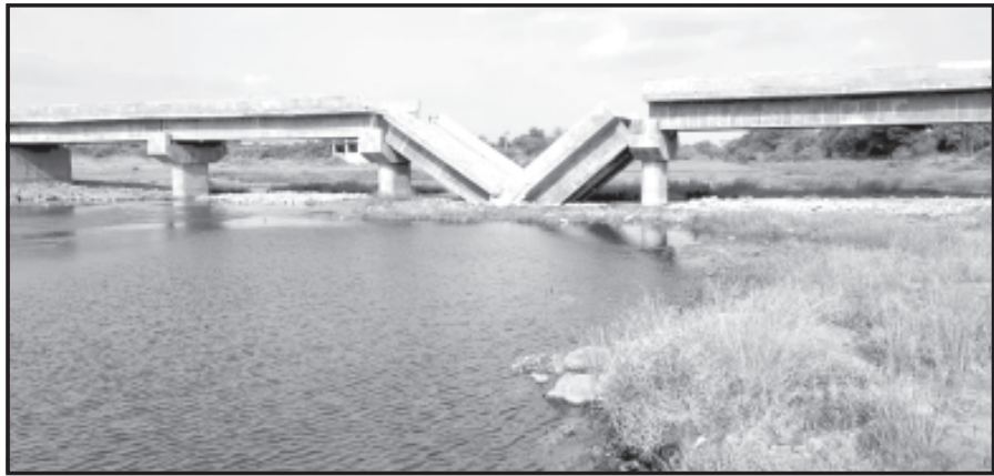
એક દાયકાથી ગાઈ-વગાડીને કહે છે કે "ખાતો નથી ખાવા દેતો નથી" પરંતુ તે માત્ર જનતાને મૂર્ખ બનાવવાનું સુત્ર સાબિત થઈ રહ્યું છે અને સરકારી ભાંધકામોમાં બેફામ ભ્રષ્ટાચાર થાય તે સૌ સારી રીતે જાણે છે.

વર્ષમાં ધરાશાયી થઈ જતું હોય છે. સરકારનાં મુખ્યા છેલ્લા