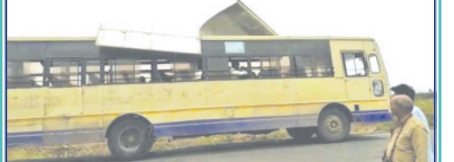
એક તરફ "સલામત સવારી, એસ.ટી. અમારી" જેવું રૂપાળુ સુત્ર પરિવહન વિભાગે ચલાવ્યું છે અને બીજી તરફ મોટાભાગની બસો ખખડધજ હાલતમાં દોડતી જોવા મળે છે. મુસાફરોનાં હિત કરતાં સ્વહિતમાં રાચતાં અધિકારીઓ કે પદાધિકારીઓને હવે શરમ જેવું કાંઈ રહ્યું નથી. ત્યારે દામનગર-સતાધાર રૂટની બસની છત હવામાં લટકતી જોવા મળે છે.

એસ.ટી. બસનો વિકાસ છાપરે ચડીને બહાર આવ્યો