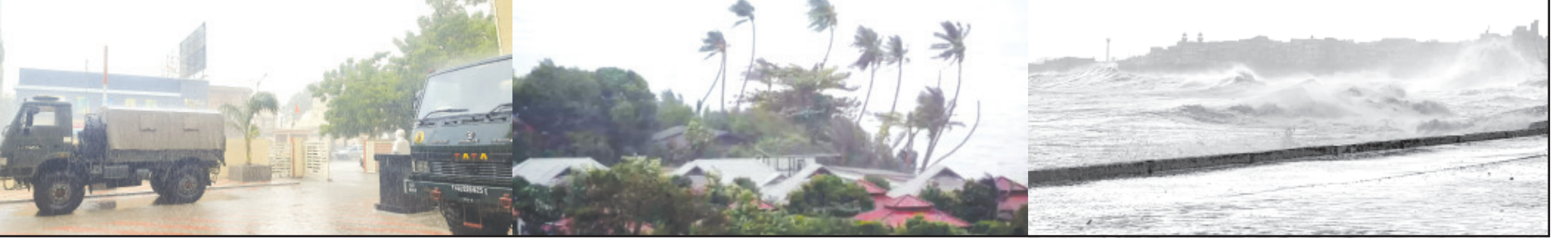
કચ્છ, તા. ૧૫ : કચ્છનાં નવિયામાં વાવાઝોડાની ભારે અસર વર્તાઈ રહી છે. ત્યારે કચ્છમાં રાતથી જ ભારે પવન સાથે ધોધમાર વરસાદ વરસી રહ્યો છે. ત્યારે ભારે પવન સાથે વરસાદની વિજીબીલિટી થઈ છે. તેમજ ૮૦ થી ૧૦૦ ની સ્પીડે પવન ફૂંકાઈ રહ્યો છે. રાજકોટનાં ધોરાજીમાં વાવાઝોડાને લઈને તંત્ર સજ્જ છે. તેમજ તંત્ર દ્વારા તમામ તૈયારીઓ પૂર્ણ કરી દીધી છે. તેમજ ફૂડ પેકેટ, મેડિકલ કીટ સાથે તંત્ર સજ્જ બન્યું છે. ધોરાજી શહેર અને ગ્રામ્ય વિસ્તારમાંથી લોકોનું સ્થળાંતર કરાયું છે. તેમજ સરકારી અધિકારીઓ, સામાજિક સંસ્થાઓ સેવામાં જોડાઈ છે. અનુસંધાન પાના ૬ ઉપર

સૌથી વધુ ગંભીર સ્થિતિ દેવભૂમિ ઢારકા, કચ્છ અને પોરબંદર જિલ્લામાં જોવા મળી