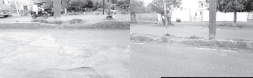
પ્રસ્તુતિ : પ્રિયંક પાંધી, સા.ફુંડલા.

સાવરકુંડલા, તા. ૧૪ સાવરકુંડલા શહેરના હાથસણી રોડ પહોળો તો થયો રોડની વચ્ચે ડિવાઈડર પણ થયાં. પરંતુ એ ડિવાઈડર પણ હાલ ક્ષતિગ્રસ્ત છે જેની મરામત પણ જરૂરી છે, વળી આ રસ્તો પણ હવે મરામત માંગે છે. વળી આ રોડ પર રાત્રે અને સાંજે અનેક નાગરિકો વોર્કિંગ માટે પણ નીકળે છે. એટલે લગભગ દોઢેક વર્ષ પહેલાં સાવરકુંડલાના વોર્ડ નંબર પાંચનાં રહીશો તથા વોર્ડ નંબર પાંચનાં ચારેય નગરપાલિકા સદસ્યો તથા એક ભૂતપૂર્વ નગરપાલિકા સદસ્ય સમેત સો કરોડનાં વધારે વ્યક્તિની સહીથી એક લેખિત અરજી સાવરકુંડલા નગરપાલિકા ચીફ ઓફિસર નકલ રવાના ચેરમેન જિલ્લા બાંધકામ સમિતિ તથા સાંસદને કરવામાં આવેલ. જોકે આજ સુધી તેનો યોગ્ય ઉકેલ આવ્યો નથી. આ ઉપરાંત આ વિસ્તારના રહીશો માટે સિનિયર