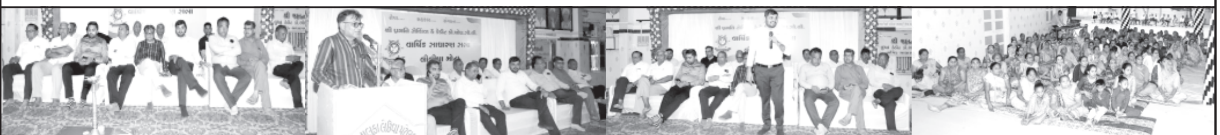
લીલીયા શ્રી પ્રગતિ સેવિંગ્સ એન્ડ ક્રેડિટ કો-ઓપ. સોસા. લિ.ની ૧૮મી વાર્ષિક સાધારણ સભાની નિમિત્તે

સંસ્થાના બોર્ડ ઓફ ડિરેક્ટર દ્વારા મહત્વના ત્રણ નિર્ણયો લેવામાં આવ્યા. પ્રથમ સંસ્થાનું નવનિર્મિત દિલીપ સંઘાણી