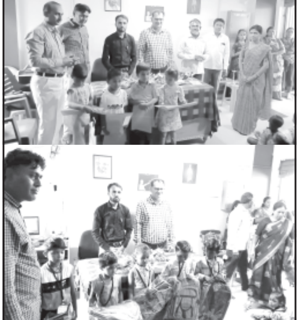
જાફરાબાદ, તા. ૧૪

જાફરાબાદ તાલુકાની શ્રી સાગર પ્રાથમિક શાળા જાફરાબાદમાં સાગર પ્રાથમિક શાળા, નુનન પ્રાથમિક શાળા, બ્રાન્ચ પ્રાથમિક શાળા અને આંગણવાડીના બાળકો માટેનો કન્યા કેળવણી મહોત્સવ અને પ્રવેશોત્સવ આજ રોજ તારીખ ૧૨/૦૬/૨૦૨૩ના રોજ ઉજવવામાં આવ્યો.