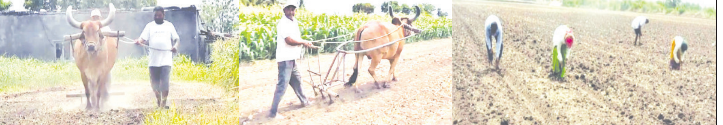
સાવરકુંડલા, તા. ૩૧ યોમાસાની હજુ વાર છે પણ આજે ભીમ અગિયારસના મુહૂર્તને

ખેતીકાર્ય દિનપ્રતિદિન કઠીન થઈ રહ્યું હોવા છતાં પણ ખેડૂતો જગતનું પેટ ભરવા માટે હિંમતભરે ખેતીકાર્ય કરીને પ્રેરણાપૂર્ણ બની રહ્યા છે