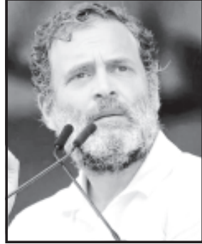
ભારતમાં કેટલાક એવા લોકો છે જે બધું જ બાળે છે. જ્યારે તેઓ વેજાનિકો પાસે જાય છે, ત્યારે તેઓ તેમને વિજ્ઞાન વિશે કહે છે, જ્યારે તેઓ ઈતિહાસકારો પાસે જાય છે, ત્યારે તેઓ તેમને ઈતિહાસ વિશે જણાવે છે. તેઓ દરેકને સૈન્યને યુદ્ધ વિશે, એરફોર્સિસમાં ઉડાન વિશે બધું કહે છે. પણ સાચી વાત એ છે કે તેઓ કંઈ સમજતા નથી. કારણ કે જો તમે કોઈની વાત સાંભળવા માંગતા નથી તો તમે તેના વિશે કંઈપણ જાણી શકતા નથી.

કોંગ્રેસ નેતા રાહુલ ગાંધી અમેરિકા પહોંચ્યા હતા. અહીં સાન ફ્રાન્સિસ્કોમાં તેઓ ભારતીયોને મળ્યા અને તેમને સંબોધ્યા હતા. આ દરમિયાન રાહુલ ગાંધીએ કહ્યું કે થોડા મહિના પહેલા અમે કન્યાકુમારીથી કાશ્મીરની યાત્રા શરૂ કરી હતી. હું પણ યાત્રામાં સામેલ હતો. અમે જોઈું છે કે ભારતમાં રાજકારણના સામાન્ય સાધનો જેમ કે જાહેર સભા, લોકો સાથે વાત કરવી, રેલી હવે કામ કરતા નથી. રાજકારણ માટે આપણને જે સંસાધનોની જરૂર છે તે ભાજપ અને આરએસએસ દ્વારા નિયંત્રિત છે. લોકોને ધમકીઓ આપવામાં આવી રહી છે. એજન્સીઓનો ઉપયોગ કરવામાં આવી રહ્યો છે. આવી સ્થિતિમાં અમને ભાગ્ય કે ભારતમાં રાજકારણ કરવું હવે સરળ નથી. તેથી અમે યાત્રા કરવાનું નક્કી કર્યું.