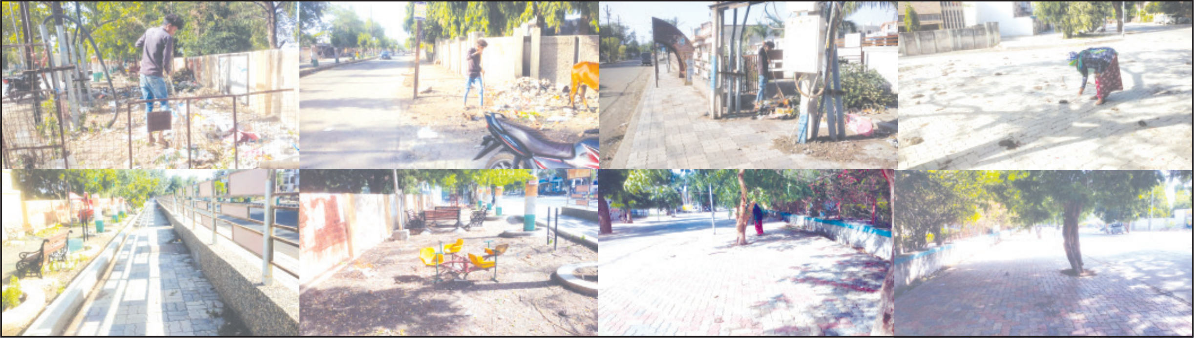
અમરેલી, તા. ૩૧ અમરેલી શહેર એ જિલ્લાનું મુખ્ય મથક હોવાથી જિલ્લાભરમાંથી આમ આદમીથી લઈને ખાસ આદમી આવતાં હોય છે અને તેમાં શહેરનાં ગૌરવસમા ચિતલ રોડ ઉપર ઉચ્ચ અધિકારીઓનાં નિવાસ સ્થાન,

શહેરીજનોને પ્રાથમિક સુવિધા જેવી કે સફાઈ, સ્ટ્રીટલાઈટ, સારા માર્ગો મળે તો પણ ભયો ભયો