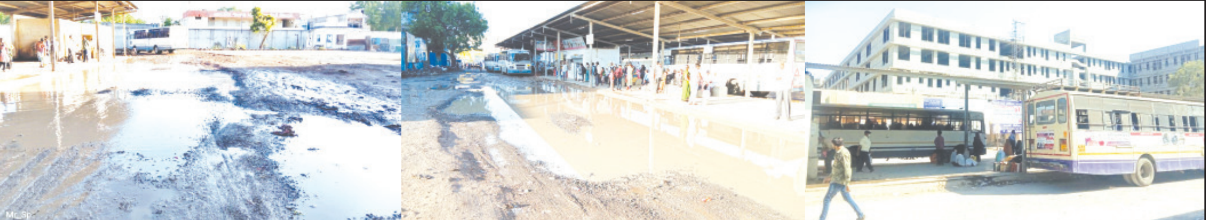
અમરેલી, તા. ૬ | સેન્ટ્રલ હંગામી બસ સ્ટેન્ડમાં સામાન્ય વરસાદ પડતાની સાથે જ કચડનું સામ્રાજ્ય છવાય જતાં મુસાફરોની હાલત "જાયે તો જાયે કહાં" જેવી કોફી બનેલ છે. બેદરકાર-નિભર તંત્ર દ્વારા મુસાફરોને કિચડરાજમાં સપડાવવા સામે ભારે રોષની લાગણી છવાયેલ હતી. પ્રાપ્ત વિગત મુજબ અમરેલીનાં નવા બસ સ્ટેશનનું નિર્માણકાર્ય છેલ્લા છ વર્ષથી ગોકળ ગતિએ ચાલી રહેલ છે. ત્યારે નવા બસ અનુસંધાન પાના ૬ ઉપર

એકાદ ધારાસભ્ય કે સાંસદ મુસાફરવર્ગમાં નવું બસ પોર્ટ શરૂ કરાવવા આગળ આવે તેવી માંગ ઉભી થઈ