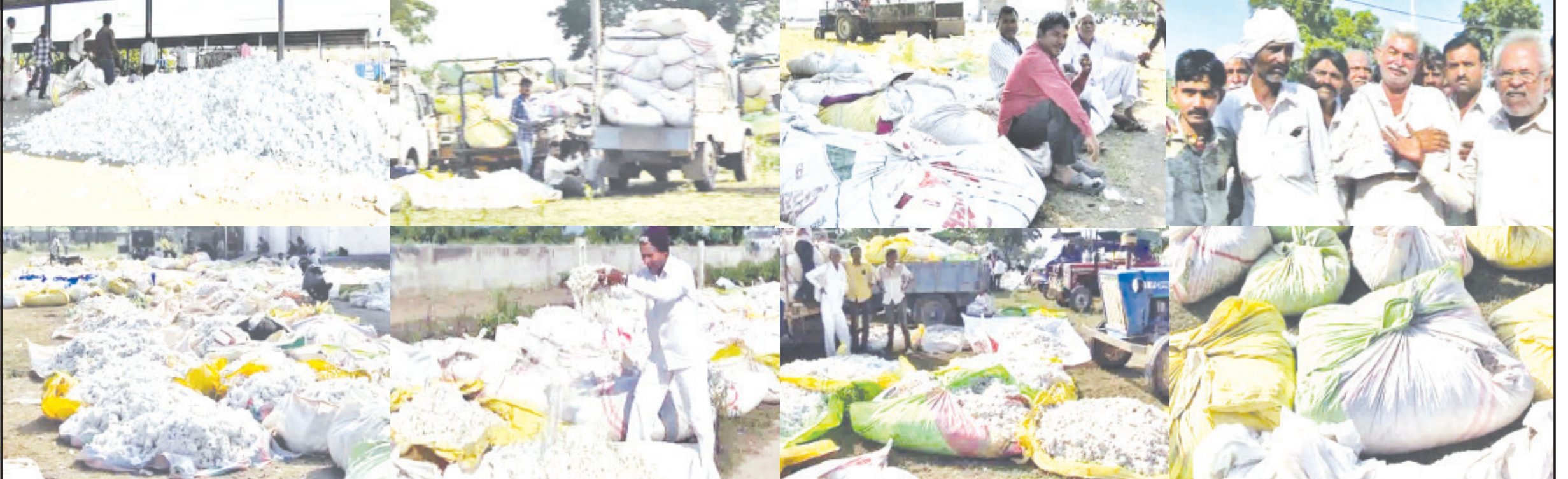
અમરેલી, તા. ૨૪ પકવાતી ખેત જણસોને લઈને જગતના કાળી મજૂરી કરીને તાત દિવસેને દિવસે પોષણક્ષમ ભાવોને લઈને વ્યાપક નિરાશામાં ગરકાવ થઈ ગયા છે. ત્યારે અમરેલી જિલ્લાના એપીએમસીઓ જાહેર હરરાજીમાં ખેડૂતોને કપાસના માત્ર ૧૨૦૦ થી ૧૪૫૦ સુધીમાં ભાવો મળતા ખેડૂતો જાયે તો જાયે ક્યાં જેવી સ્થિતિ નિર્માણ પામી છે. અમરેલી જિલ્લાના એપીએમસી સેન્ટરમાં અમરેલી, સાવરકુંડલા, રાજલા, લાહી, બાબરા, ધારી, બગસરા, ટીબી, ખાંભા માર્કેટીંગવાઈ આવેલા છે ને કપાસ હજુ પણ ચાર્ડમાં ઠલવાઈ રહ્યો છે પણ ખેડૂતોને જે ભાવ મળવા જોઈએ તે કપાસમાં હજુ મલી રહ્યા ના હોય ત્યારે ખેડૂતો હૈયા વરાળ કાઢી રહ્યા છે કેમ કે ચૂંટણી સમયે ૨ હજાર ઉપરના કપાસના ભાવો સામે હાલ ૧૨૦૦ થી લઈને ૧૪૫૦ સુધીના ભાવો ખેડૂતોને અનુસંધાન પાના ૬ ઉપર

આગામી દિવસોમાં ભાવમાં હજુ પણ ઘટાડો થવાની સંભાવનાથી ખેડૂતોની ચિંતામાં સતત વધારો થઈ રહ્યો છે