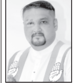
આ મિટિંગ તારીખ ૨૬ને શુક્રવારના રોજ સવારે ૧૧ કલાકે મળવામાં આવનાર છે ત્યારે આ બેઠકમાં