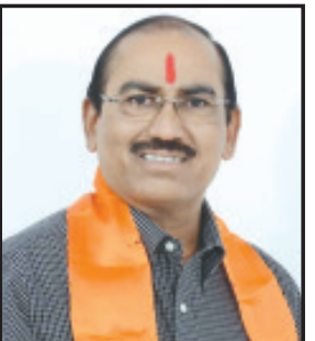
પત્રમાં જણાવેલ છે કે, ખેતી વિષયક સ્વૈચ્છિક જાહેરાત - ૨૦૨૨, હેઠળ ખેતી વિષયક વિજબોડાણની લોડ વધારાની

અરજીઓ માટે ખેડૂત અરજદારો માટે કીલ્લ સર્વિસ કનેક્શન ચાર્જમાંથી મુક્તિ આપેલ છે. એટલે કે કોઈપણ ખેડૂતને ખેતીવાડીનાં હયાત વિજકનેક્શનમાં લોડ વધારો લેવો હોય તો તેનો કોઈ ચાર્જ નહીં ભરવાનો એન ખેડૂતોને કોઈપણ રૂપીયાનો ચાર્જ ચુકવ્યા વગર લોડ વધારો કરી માં આપવાનો સરકારે જે નિર્ણય લીધો તે બદલ ખુબ ખુબ અભિનંદન, પરંતુ કમોસમી વરસાદનાં લીધે ખેડૂતો ખેતીનાં કામમાં રોકાયેલા હતા. અને તેનાં લીધે અનેક લોકો સુધી ખેતીવાડીનાં વીજકનેક્શનમાં ફી માં લોડ વધારો આપવની આ યોજનાનાં સમાચાર ધણા ખેડૂતો સુધી પહોંચ્યા ન હતા. તા. ૩૧/૫/૨૦૨૩ સુધી જ આ યોજનાનો લાભ લઈ શકાય તેમ છે.