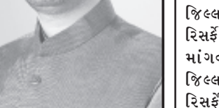
રિસર્વેસિંગ એક કરોડ પચ્ચીસ લાખનું કામ, ચોકી-નવા ઉજળા રોડ ગ્રામ્ય માર્ગનું ૨.૦૦ કિ.મી. રિસર્વેસિંગનું રૂપિયા પચ્ચાસ લાખનું કામ, બાબાપુખર- થોરી રોડ મુખ્ય જિલ્લા માર્ગ ૪.૦૦ કિ.મી. રિસર્વેસિંગનું એસી લાખનું કામ,