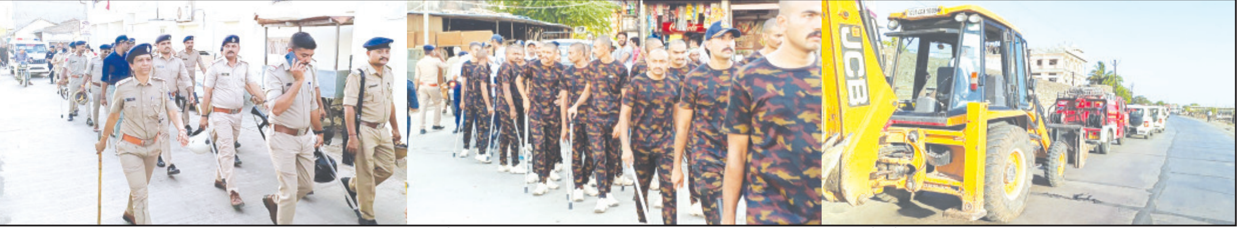
અમરેલી, તા. ૨૨ અમરેલી શહેરમાં ગત અઠવાડિયે અમરેલી પાલિકા દ્વારા

માત્ર સામાન્ય દબાણ હટાવાશે કે મહાકાય દબાણને હટાવાશે તેના પર સૌની નજર