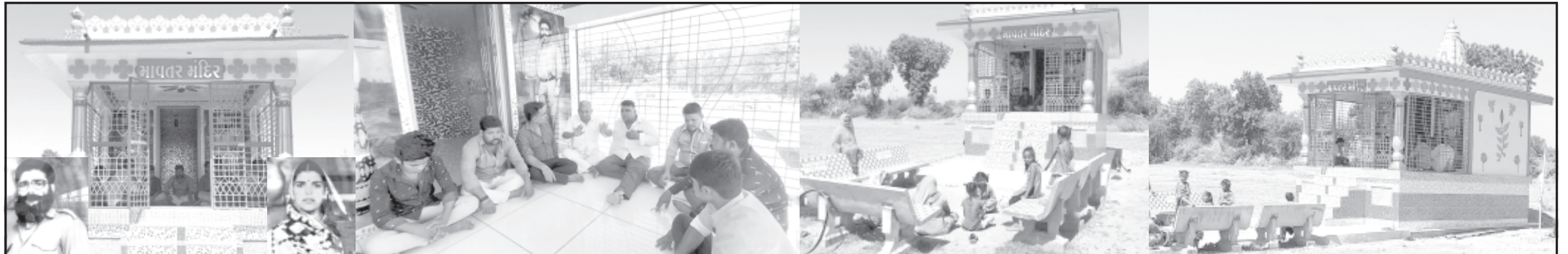
અમરેલી, તા. ૨૨ "ભુલો ભલે બીજુ બધુ, મા-બાપને ભુલશો નહીં", આ ઉક્તિ અમરેલીના એક પરિવારે સાર્થક કરી

વિચરતી જાતિ અને અશિક્ષિત પુત્રોએ એજ્યુકેટેડ દીકરાઓને માર્ગ ચિંધ્યો