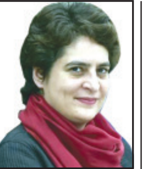
ભયાનકપણે નિરાશાનો માહોલ જોવા મળી રહ્યો છે. લોકસભાની ચૂંટણીને