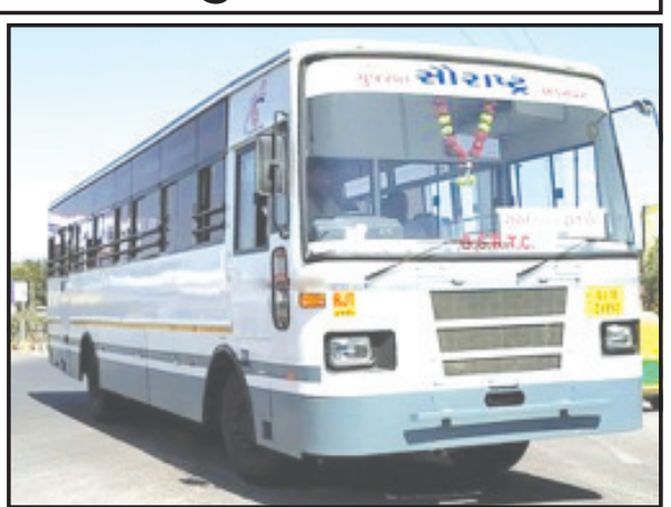
કેટલાક સમયથી બંધ કરી દેવાતા મુસાફરોમાં નારાજગી અને રોષનું વાતાવરણ જોવા મળી રહ્યું છે. આ બસ વાપી જવા માટે મુસાફરોને ખૂબ જ

અમરેલી-વાપી એસ.ટી. રૂટની બસ ઘણા સમયથી અચાનક જ બંધ કરી દેવાતા મુસાફરોને હેરાનગતિ થવા પામી છે. આ રૂટમાં ડાયરેક્ટ વાપી જવા તેમજ આજુબાજુના ગામોમાં જવા માટેનાં મુસાફરોને આ બસ ખૂબ જ અનુકૂળ રહેતી હતી. આ બસમાં મુસાફરોનું ટ્રાફિક પણ રહેતું હતું. ત્યારે આ રૂટની બસ અચાનક જ બંધ થતાં મુસાફરોને હેરાનગતિ થઈ રહી છે. ત્યારે વલસાડ ડેપોની આ બસ બંધ થતાં અમરેલી ડેપો દ્વારા વાપી રૂટની બસ શરૂ કરવામાં આવે તેવી પણ માંગ ઉઠવા પામેલ છે. પ્રાપ્ત માહિતી અનુસાર એસ.ટી. વિભાગ દ્વારા અમરેલીથી વાપી જવા માટેની એકમાત્ર બસ