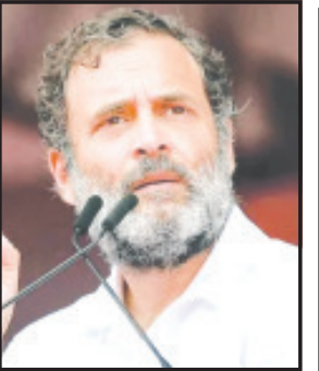
વિધાનસભાની ચૂંટણીમાં કારમો પરાજય પામનાર કોંગ્રેસ પક્ષમાં