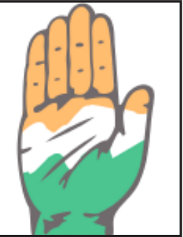
માત્ર ૧૧ મહિનાનો સમય બાકી હોવા છતાં એકલ-દોકલ આગેવાન સિવાય