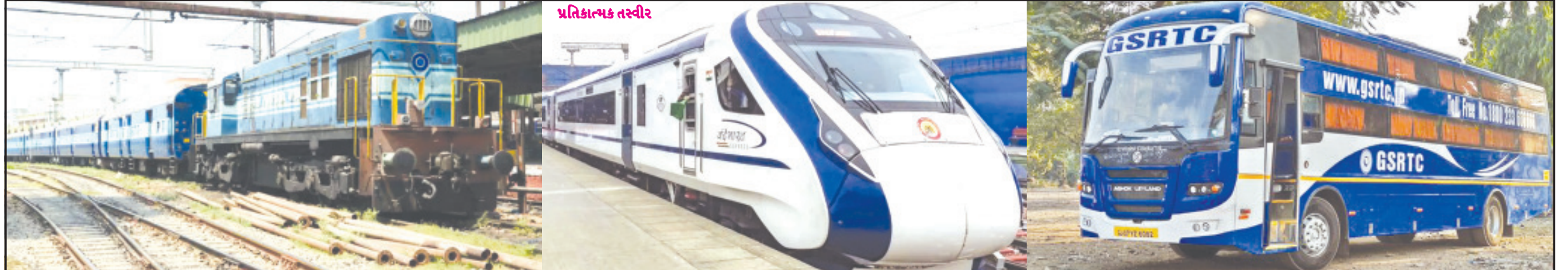
અમરેલી, તા. ૨૦

બ્રોડગેજ કે બુલેટ ટ્રેન એક દાયકા પહેલા કોઈપણ સંખેગોમાં મળે તેમ ન હોય બસ સેવામાં વધારો કરવો જરૂરી