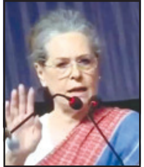
અમરેલી, તા. ૨૦ અમરેલી જિલ્લામાં

ભાજપનાં હાથે છેલ્લા ૩૦ વર્ષથી માર ખાતી કોંગ્રેસમાં હવે નિરાશાનો માહોલ જોવા મળે છે