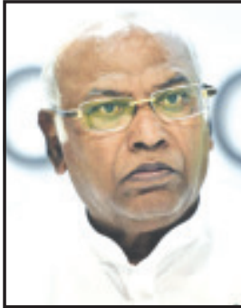
અન્ય તમામ આગેવાનો અને કાર્યકરો ક્ષાટિકમાં કોંગ્રેસને મળેલ સફળતાનો

આનંદ માણીને પુશ થઈ રહ્યાં છે. અમરેલી જિલ્લામાં છેલ્લા ૩૦ વર્ષથી કોંગ્રેસ પક્ષનાં વળતા પાણી