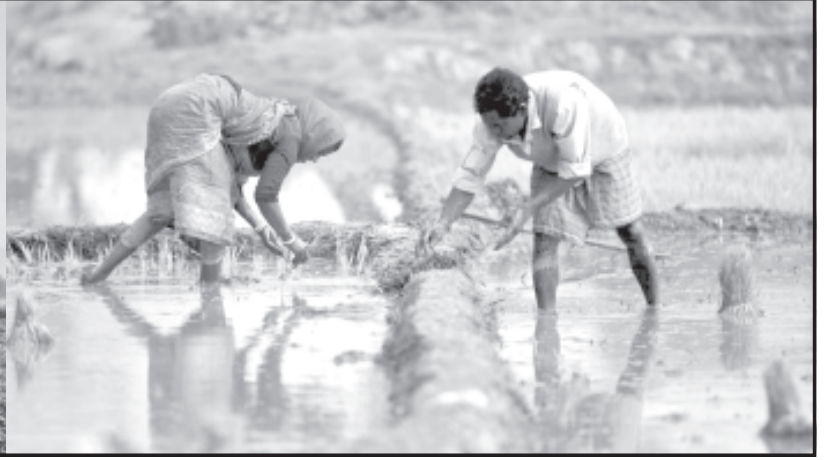
અમરેલી, તા. ૧૭

સામગ્રી લોહી-પાણી એક કરીને તૈયાર કરતાં ખેડૂતોને એટલે તો જગતના કહેવામાં આવે છે. પરંતુ આજે જગતનું