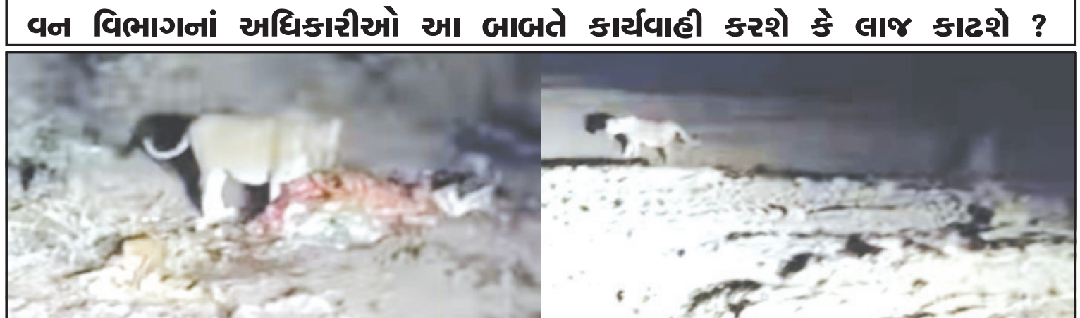
અમરેલી, તા. ૧૫ જ્યાં વાડ જ ચિબડા ગળી જતી હોય ત્યાં દોષ કોને આપવો તેવો ઘાટ આજે બગસરા પંથકનાં ભાજપનાં એક આગેવાન દ્વારા કરવામાં આવ્યો છે. જેમાં ભાજપનાં આગેવાને મારણ ઉપર બેઠેલા સિંહ પાછળ કાર દોડાવી સિંહની પજવણી કરી હતી. ઉપરાંત અનુસંધાન પાના ૬ ઉપર