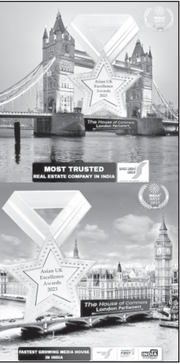
(Gujarat) અને ઓટીટી ઈડિયા ભાષાઓમાં સંચાલિત ગુજરાતનું (Hindi, English) આમ ત્રણ પ્રથમ મીડિયા હાઉસ બન્યું છે.

અમરેલી, તા. ૧૫ યુનાઈટેડ કિંગડમના હાઉસ ઓફ કોમન્સ એટલે કે (લંડનની સંસદમાં) યોજાયેલી એવાર્ડ સેરેમની એશિયન યુકે બિઝનેસ એવાર્ડ ૨૦૨૩માં સિદ્ધિ ગૃપ ઓફ કંપનીઝને એક નહી પણ બંને મોંઘેરા સન્માન મળ્યાં.