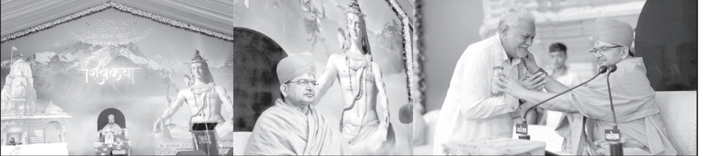
ખજૂરી મુકામે શ્રી સિદ્ધેશ્વર મહાદેવ મૂર્તિ પ્રતિષ્ઠાનો પ્રારંભ થયો છે. પોથીયાના શિવમહાપુરાણમાં શિવપાર્વતીના લગ્ન નંદ ઉત્સવ સહિતના કાર્યક્રમો યોજાયા હતા સાથે ધામધૂમથી આજના મંગલ દિવસે શિવપુરાણ મહાકથાનો પ્રારંભ કરવામાં આવેલ છે. વક્તા શાસ્ત્રી સ્વામી આનંદ સ્વરૂપદાસજી શ્રી સ્વામિનારાયણ દિવ્યધામ વડીયા દ્વારા શ્રોતાઓને રસપાન કરાવ્યું હતું. શિવમહાપુરાણનું શ્રવણ કરવા માટે કેન્દ્રીય મંત્રી પુરુષોત્તમ રૂપાલાએ હાજરી આપી હતી ત્યારે ગુજરાત વિધાનસભાના નાયબ મુખ્ય ઠંડક કૌશિકભાઈ વેકરીયા પણ શિવમહાપુરાણનો લાભ લીધો હતો. સમસ્ત ગ્રામજનોએ મોટી સંખ્યામાં ઉપસ્થિત રહી કથાનું રસપાન કર્યું

પાના ૮ ઉપરનું ચાકું અમરેલીનાં કથિત અંધાપાકાંડમાં માનવ અધિકાર ભંગની ફરિયાદમાં આયોગે ગંભીર બનાવમાં નોટિસ કાઢી રાજ્યના આરોગ્ય સચિવ પાસે ચાર અઠવાડિયામાં એક્શન ટેકન રિપોર્ટ માંગેલ હતો અને આયોગ દ્વારા પ્રાથમિક તપાસ કરવાની કાર્યવાહી શરૂ કરવામાં આવેલ હતી.