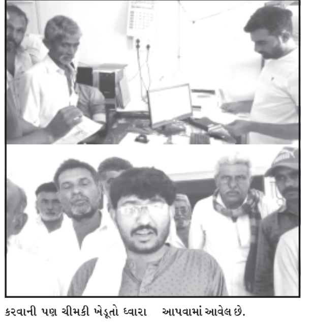
કરવાની પણ ચીમકી ખેડૂતો દ્વારા આપવામાં આવેલ છે.

અમરેલી જિલ્લામાં કમોસમી વરસાદનાં કારણે ખેડૂતોને ભારે નુકસાની સહન કરવી પડી હોય. ત્યારે સરકાર દ્વારા કમોસમી વરસાદથી થયેલ નુકસાની માટેનો સર્વે હાથ ધરવામાં આવ્યો છે. ત્યારે ધારી પંથકનાં ગીર વિસ્તારમાં આવેલ ગીગાસણ તથા ઈગોરાળા (ડુંગરી) ગામે થયેલ સર્વેમાં લોલમલોલ થયાનો આક્ષેપ સાથે ધારી ખાતે આવેલ મદદનીશ ખેતીવાડી નિયામકને આવેદનપત્ર પાઠવવામાં આવ્યું હતું. સર્વે હાથ ધરવામાં આવ્યા બાદ લગભગ ૫૦ ટકા જેટલા ખેડૂતો સહાયથી વંચિત રહી ગયા હોય અને જો આવા ખેડૂતોનો સર્વે હાથ ધરી અને સહાય નહી આપવામાં આવે તો ગાંધી ચિંધ્યા માર્ગે આંદોલન કરવાની પણ ચીમકી ખેડૂતો દ્વારા આપવામાં આવેલ છે.