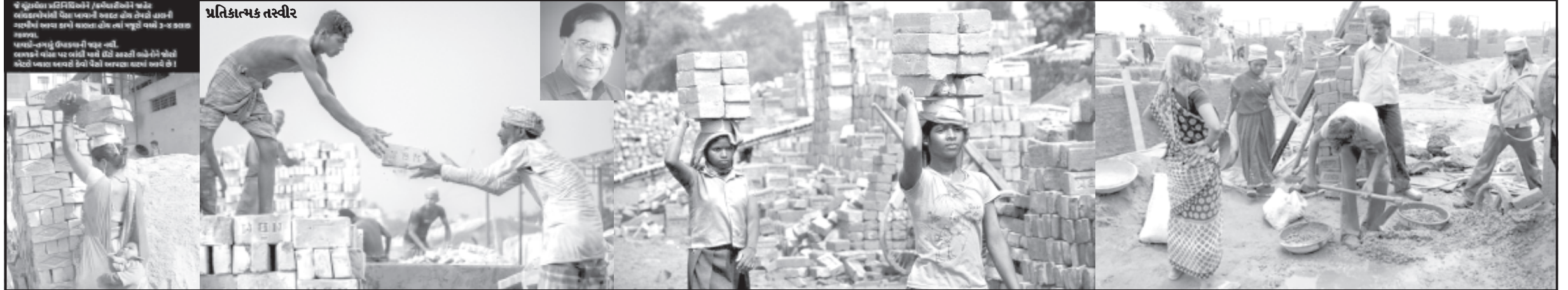
અમરેલી, તા. ૧૫

ભાજપ સરકારમાં ચાલતા ભ્રષ્ટાચાર સામે ભાજપનાં અગ્રણીએ જ કટાક્ષ કરતાં ભારે ચક્રાચર ઉભી થઈ