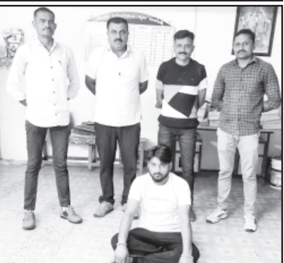
મજકુર ઈસમને હસ્તગત કરી અમદાવાદ રૂરલના કેરલા જી.આઈ.ડી.સી. પોલીસ સ્ટેશન પેટ્રોલીંગમાં ભુંટ કરેલનું કબુલાત આપતા